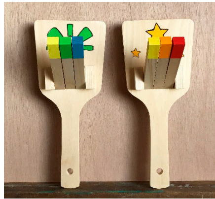
【図6】 鳴子キット 各L180mm×W87mm