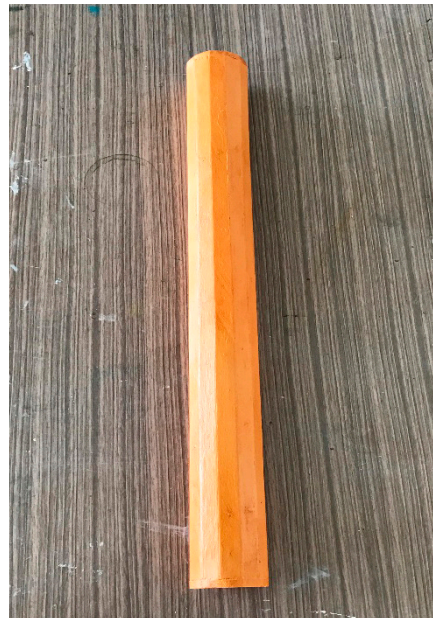
【図8】 レインスティック (彩色済み) 約50φ×L520mm