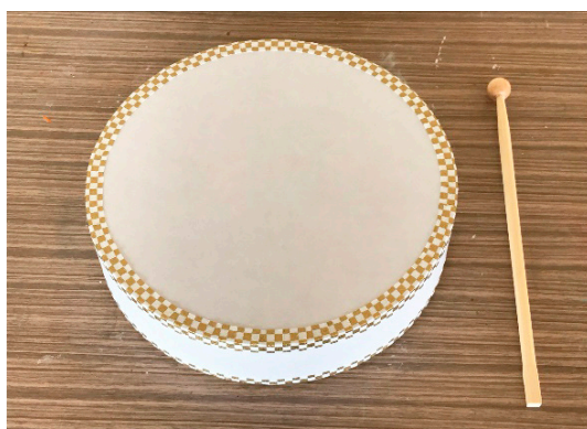
【図4】 エイサーくん(パーランクル) 194φ×H45mm

る。張力を強くすると、音程が高くなり、パンパンといった余韻をともなった音質となった。民族楽器トーキングドラムやミニボンゴについては、鼓面に本革を使用しており材料費として高額な点、特にトーキングドラムは細かいバルサ材の貼り付けや複雑な紐編み作業が複雑な点で教材化は難しい印象を持った。その中で、沖縄の伝統的な手持ち太鼓であるパーランクルのキットである「エイサーくん」は組み立てが容易さ、材料費も抑えられ、音の響きも良い【図4】。これは、前述の三線のボディでも使用されていたファイバークラフト紙を鼓面の素材として用いられていることが大きい。このファイバークラフト紙は通常時は硬質であるが、水に浸すと柔らかく質が変化するが破れにくい素材である。このパーランクルキットにおいても3分程水に浸した後、胴部に貼り付けた。乾燥すると収縮するので、教材として製作する太鼓の鼓面素材としては最適であると考えられる。