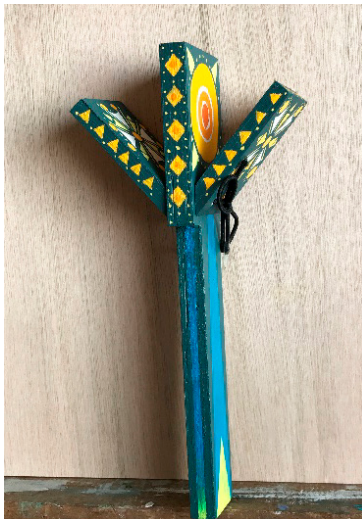
【図5】 インディアンクラッパー L約210mm