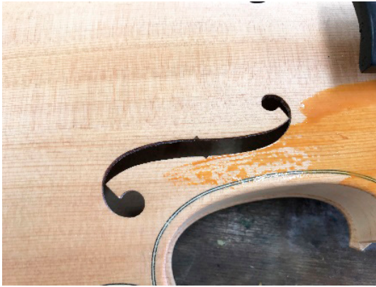
【図9】 ヴァイオリンボディへの アクリル絵具の擦り込み

場合、ジェッソなどの下地塗料を施した後の彩色が理想であるが、水を多く混ぜた絵具であれば、しみ込ませるように塗ることができる。一方で、音楽のキットでも多くは吸水性の高い木材が使われていたが、肌理の細かいメープル材のヴァイオリンは水気の多い絵具を弾く傾向にあったが、布などで擦り込むことで定着させた。2層目以降は、問題なく重層による描画ができた【図9】、【図10】。