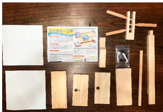
【図1】ファイバー三線（組み立て前）

組み立て式と組み立て済みの2種ある）である。ウクレレのキットについては、ボディは既に組み立て済みであり、ネックとフィンガーボードについては木工用ボンドでの接着となった。また、「南風ワクレレ」や「ファイバー三線」【図1】についてはボディ部分も組み立て式となっている。特に三線については、本来革を使用する部分にファイバークラフト紙*を採用しており、材料費を抑えている。