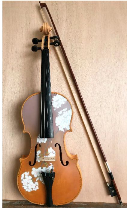
【図10】 ヴァイオリンキット（組み立て、彩色済み） L600mm×W200mm×H65mm, 弓L750mm

カリンバは空き缶や竹串、平たいプラスチックのナイフやスプーンのような身近な物を組み合わせて工夫を凝らすことによって、様々な音色を作り出すことができるだろう。