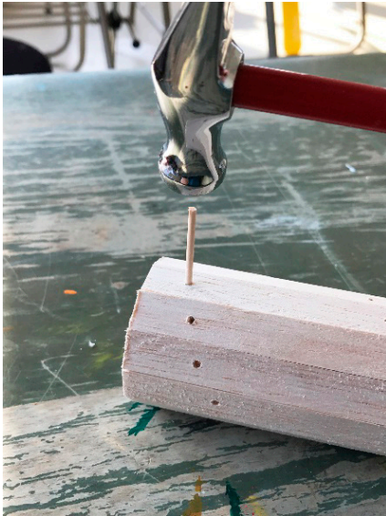
【図7】 レインスティック木釘工程