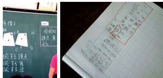
図1 めあての囲みを間違えている様子

算数の合同に関する授業におけるFY児の事例である。下の写真から、FY児のノートは、右の囲みを間違っていることがわかる。