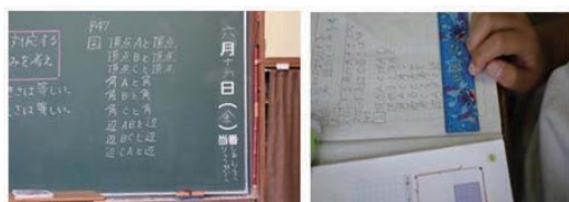
図2 問題の羅列と定規によるサポート

算数の図形の合同についての授業でのU児の事例である。U児は黒板の文字をノートに写すことは問題なくできた。解答する問題は、教科書の図形を見て、ノートに写した問題を見て、再び教科書を見てから回答する。何度も視点を動かし、記憶した情報と照らし合わせなければいけない。WMの低いU児は、問題と回答欄にズレが生じ、回答すべき問題を見失っていた。この問題にはU児にとってあまりなじみのないアルファベットが使われていたことも、リソースを消費する要因と考えられる。