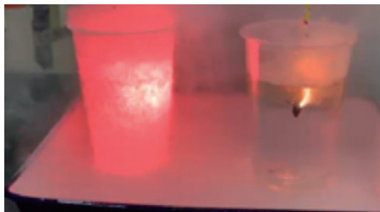
図2. 紙巻き花火を液体につけた様子。左が液体窒素中、右が水中

火は液体窒素にひたすと、瞬時に消えた。また、液体窒素の液面に近づけるだけで暗くなり消えたように見えたが、この段階で空気中に戻すと燃焼が再開した。液体窒素の表面近くでも盛んに窒素が気化しており、酸素欠乏状態なので、線香花火はほとんど消えたようになったが、完全には消えておらず、新鮮な空気中では再び赤く燃焼するようすが観察できた。