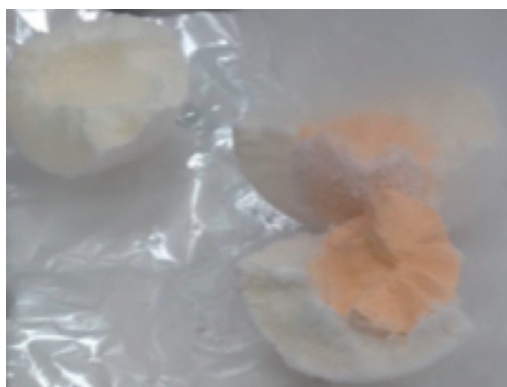
図5. 冷却され固まった生卵。見た目ではゆで卵と区別がつかない

結果として固定されるから弾性は失われ、伸ばされたゴムは伸びたまま、縮んだゴムは縮んだまま、硬いことを説明した。例年、質疑応答で詳しく聞かれることが多く前年度まではホワイトボードの図と口頭の説明を行っていたが、今年度は分子模型モデルを用いて詳しく説明した。