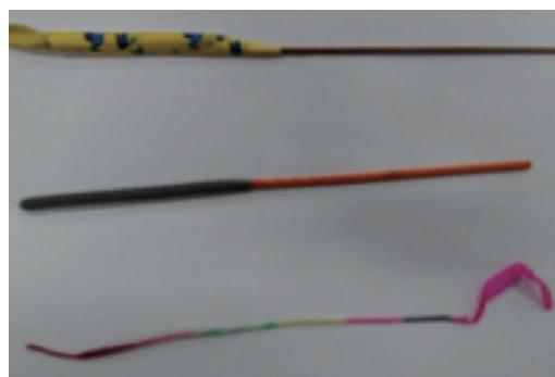
図1. 三系統の花火(上から紙巻き花火, スパークル花火, 線香花火)

同様に、火の付いた花火を液体窒素中に入れた場合、紙巻き花火(図2, 左), スパークル花火(図3, 左)は液体窒素中でも燃焼した。激しく燃焼している花火の近傍では、熱のため液体窒素が瞬時に沸騰し、液体に濡れない空間がある。その部分は、気化した窒素に満たされて無酸素状態になっているが、花火に含まれる酸化剤からの酸素によって、燃焼が継続すると考えられる。それに対し、線香花