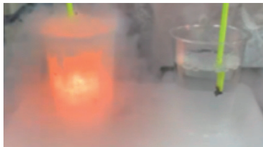
図3. スパークル花火を液体につけた様子。左が液体窒素中、右が水中

燃焼が継続するための必要条件は、燃えるもの、熱、酸素（または新鮮な空気）が供給され続けることである。紙巻き花火（図2，左）、スパークル花火（図3，左）では、どちらも燃焼部分が直接液体窒素に触れていないので、それほど熱が奪われないで済む。線香花火は、火力が弱いので液体窒素に入れるとすぐに濡れ、冷やされるので、瞬時に消火したのである。