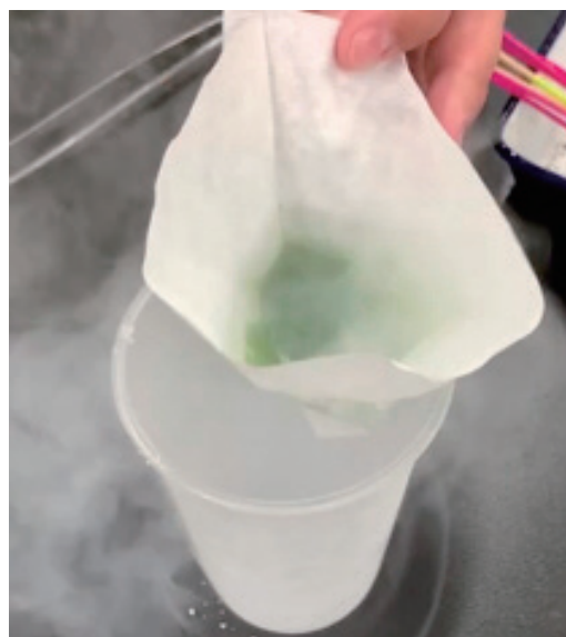
図4. 濁った液体窒素を濾過する様子

図4のコップには、無色透明の液体窒素が溜まったことが確認できた。このようすも動画で撮影することにより、学校教育で学んだろ過のイメージに近づけ、液体窒素も、「液体」としてのイメージがわか教材とした。