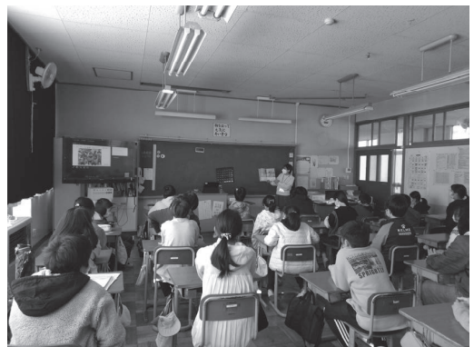
矢板市立矢板東小学校さま（5年生クラス）

読み聞かせ当日、まずは絵本を読む前に電子黒板の大きなスクリーンでアフリカ・タンザニアを紹介しました。学年によっては、世界地図を見てもアフリカがどこにあるかわからない子どもたちもいました。間違えてもいいよ、クイズだよ、と声かけすると、活発に手を挙げてくれました。アフリカの地図を映しながら、アフリカには55を越す国々があることを説明すると、みんな驚いていました。雨季と乾季の写真や、食べ物の写真は興味津々でした。トウモロコシでできたウガリの写真を見て、日本のトウモロコシとの違いについて感想を口にする子どももいました。中でも共同水道の写真は特に興味深かったようで、真剣なまなざしで写真を見つめている子が多かったように思います。