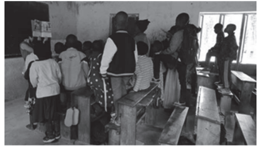
イリング小学校での読み聞かせのひとつコマ。

実現されました。小学校の内壁や外壁には、鮮やかな絵本の世界が広がりました。子どもたちは、小学校が好きになったそうです。1冊の絵本が思いがけないところでも豊かな広がりを見せていることにとても驚きました。