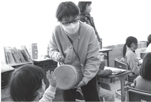
矢板市立矢板小学校さま（2年生クラス）