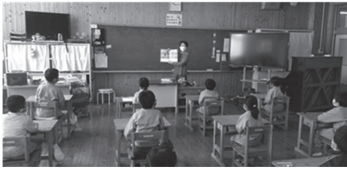
茂木町立逆川小学校さま（2年生クラス） 子どもたちの集中力が伝わってきます。

コロナ禍もあり、予定していた読み聞かせ活動が延期になった学校もありましたが、2023年2月1日現在で9校、学童1館のあわせて約252人の子どもたちに『ニョタの不思議な音楽』のお話を届けることができました。