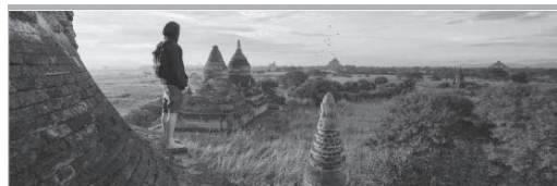
2023年度後期「多文化公共圏実践演習（グローバル）B」 West meets East 西洋が東洋を見る目、伝統ある東洋 第1回 10月13日 パヴェル・ヤンシュタ、福田美穂

How I as Westerner met East: Traveling to China, Taiwan and Japan? 西洋人と東洋の出会い、中国・台湾・日本への旅