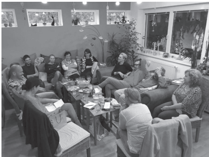
句会月見草 in ヴォドニャニ